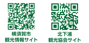
横須賀市観光情報サイト 北下浦観光協会サイト

主催 横須賀市 横須賀集客促進・魅力発信実行委員会 北下浦観光協会 協力 北下浦地域運営協議会 津久井浜観光農園 株式会社京急ストア お問い合わせ 横須賀市文化スポーツ観光部観光課 046-822-8124 (平日9:00~17:00)