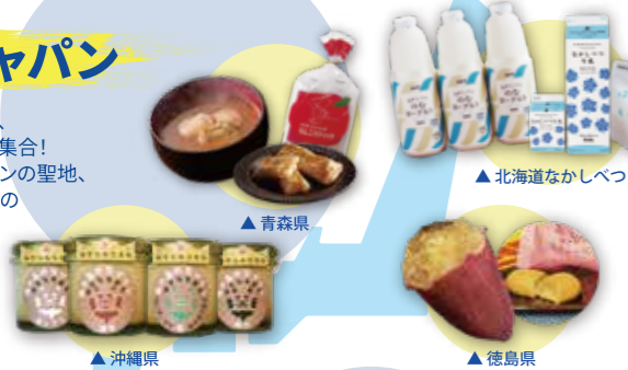
▲北海道なかしべつ

北は北海道から、南は沖縄まで大集合! ウィンドサーフィンの聖地、津久井浜に全国のご当地グルメが集まります!