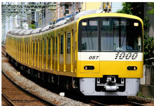
KEIKYU YELLOW HAPPY TRAIN

京急電鉄では「赤」「青」「黄」の3色の車両で，京急電車の魅力をますます感じていただけるよう，日々安全運行に努めてまいります。詳細は別紙のとおりです。