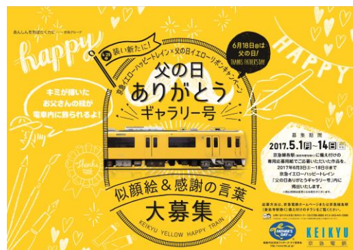
「京急イエローハッピートレイン×父の日イエローリボンキャンペーン」ポスター