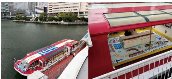
京急電車ラッピングシーバス