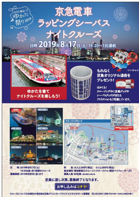
「京急電鉄ラッピングシーバス ナイトクルーズ」ポスター