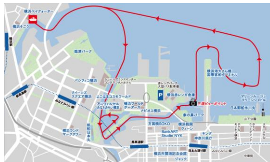
ナイトクルーズ航路（予定）