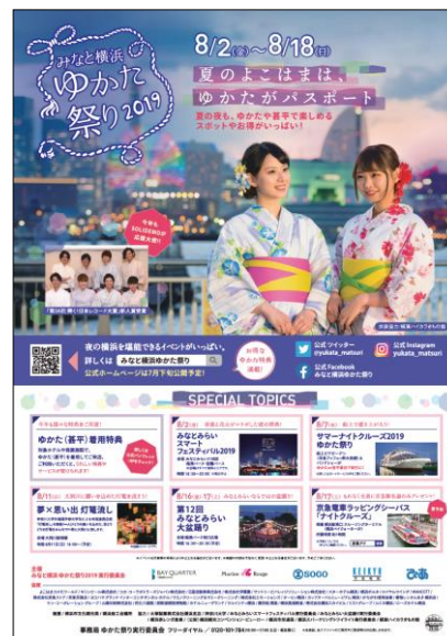
「みなと横浜ゆかた祭り 2019」ポスター