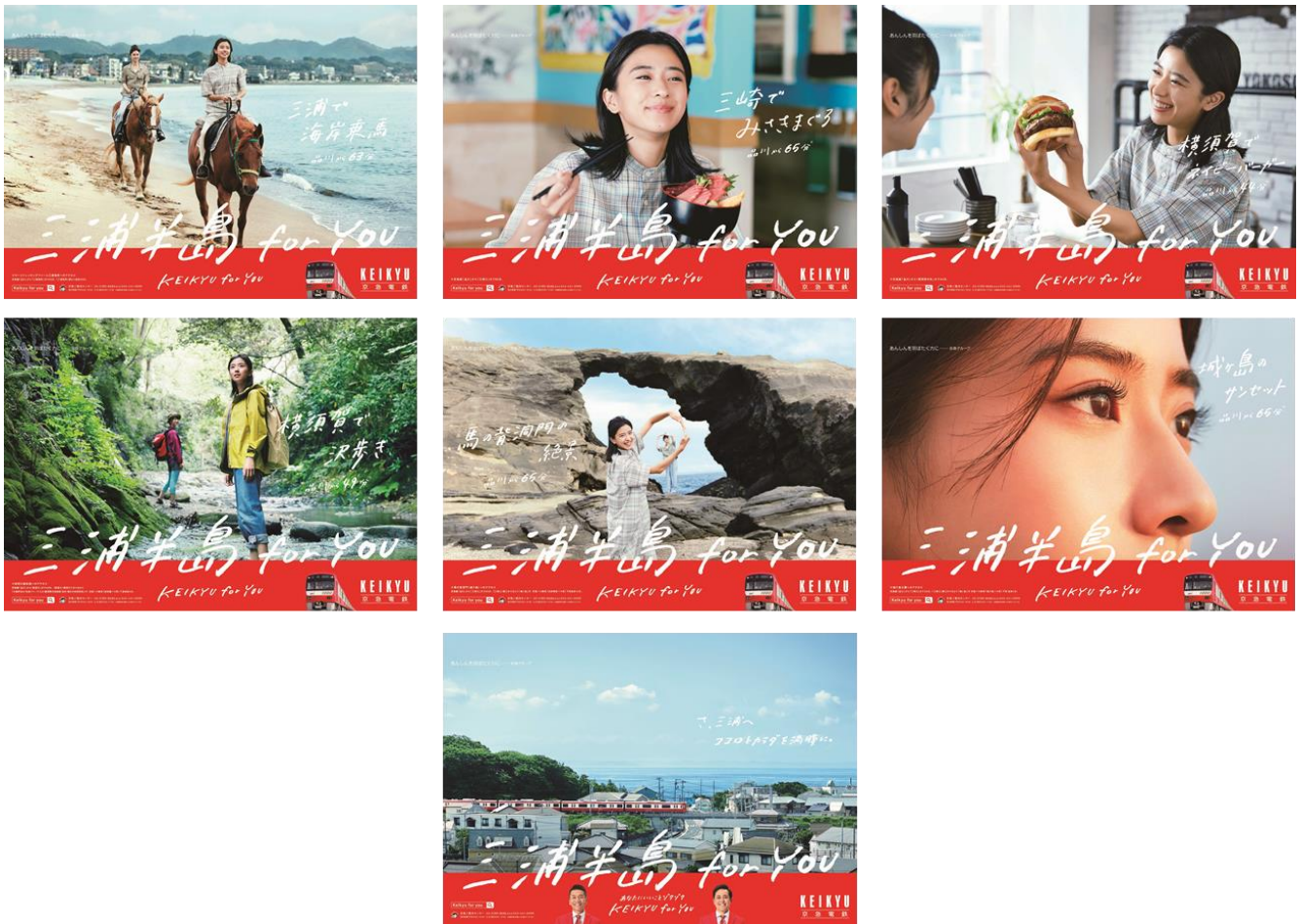
グラフィック広告

テレビCMに登場する絶品グルメやおすすめスポットなどと連動したグラフィック広告を、京急線の駅構内など交通媒体を中心に掲出します。