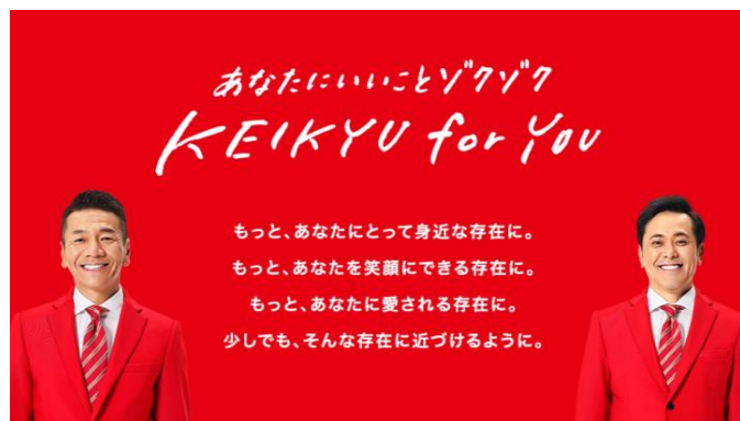
キャンペーンコンセプト