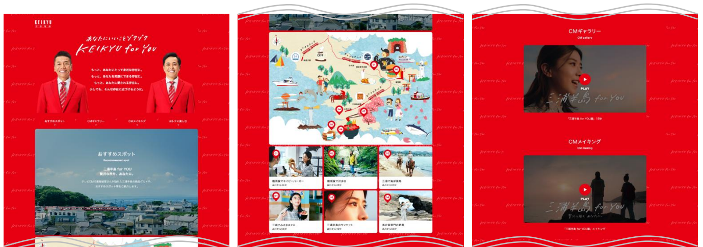
キャンペーンサイトイメージ

URL : https://www.keikyu.co.jp/information/cp/keikyuforyou/index.html