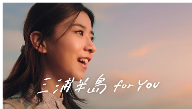
テレビCM「三浦半島 for YOU 篇」