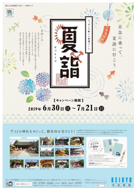
ポスター ※イメージ

京急電鉄は沿線の活性化を図るため今後もさまざまな企画を行ってまいります。詳細は別紙のとおりです。