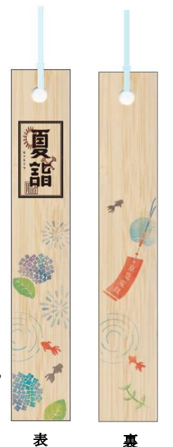
表 裏 竹しおり ※イメージ