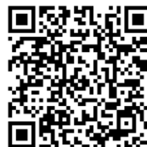
【ダウンロード用QRコード（Android）】