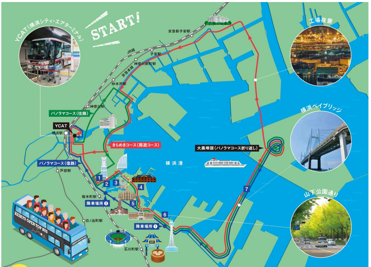
【パノラマコース・きらめきコース ルート図】