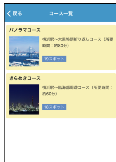
「KEIKYU OPEN TOP BUS 横浜」 のコース一覧（四言語に対応） （画面イメージ）