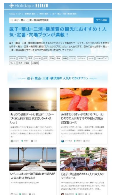
「Holiday」との コラボページ イメージ