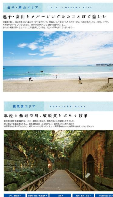
エリアガイドページ