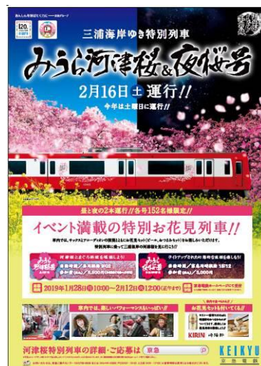
特別お花見列車ポスター