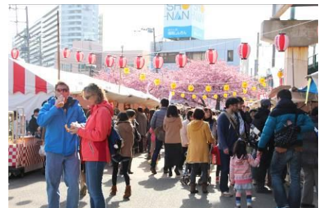
駅前のテント村の様子