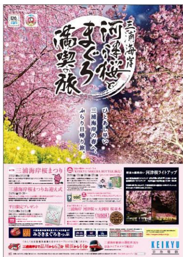
キャンペーンポスター

キャンペーン期間中は、①三浦海岸駅前および三浦海岸～三崎口駅間線路沿いの河津桜ライトアップを実施するほか、その区間にあわせて列車の減速運転を行い、通常よりゆっくりとした速度で車内からも艶やかな桜をお楽しみいただけます。また、沿線では三浦海岸河津桜ラッピング列車も運行し、2月16日（土）にはその車両を使用して、車内でビールやおつまみを楽しみながら三浦海岸へ向かう特別お花見列車の②「みうら河津桜号」と「みうら夜桜号」も運行いたします。そのほかにも、③三浦海岸桜まつり「お迎え式」、④平日来場者へのノベルティプレゼント、⑤京急で桜を見に行こう！三浦海岸 河津桜×大岡川 桜並木、⑥三浦海岸駅駅名看板の変更、⑦京急電鉄ホームページでライブカメラによる開花状況のご案内など、さまざまな取り組みを実施いたします。詳細は別紙のとおりです。