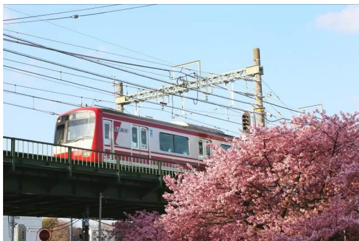
三浦海岸の河津桜

訪日外国人に京急沿線の「桜」をアピールし，京急グループの利用促進を図ってまいります。詳細は別紙のとおりです。