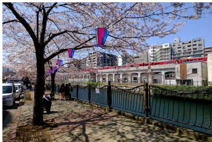
横浜・大岡川周辺の桜