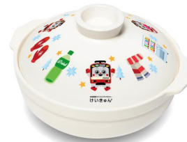
「けいきゅん土鍋」イメージ