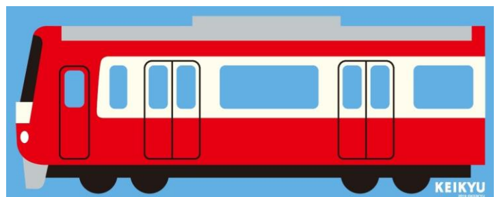
賞品 京急電車デザイン「特大ブランケット」イメージ