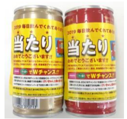
※当たりのイメージ