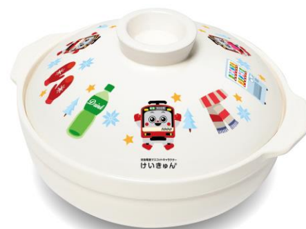
Wチャンス賞品「けいきゅん土鍋」イメージ