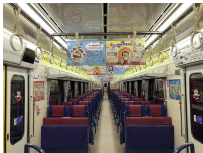
「けいきゅん号」車内