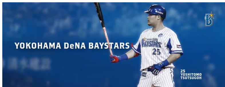
ホーム仮囲い装飾デザイン