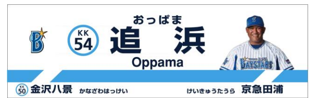
下りホーム 駅名看板デザイン