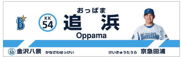
上りホーム 駅名看板デザイン