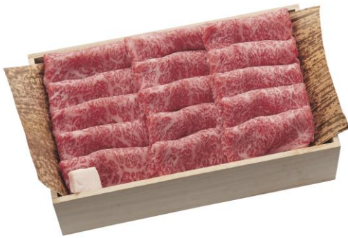
【日本橋日山】 葉山牛ロースすき焼き用 27,000円(税込)