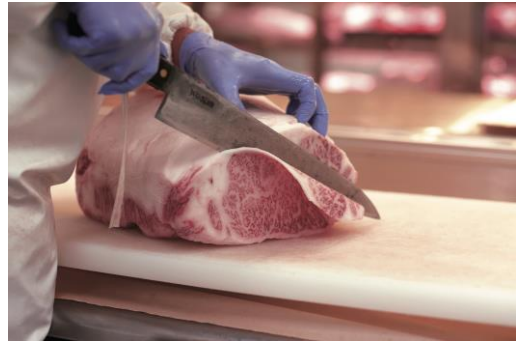
銘店【日本橋日山】が選りすぐったブランド牛肉