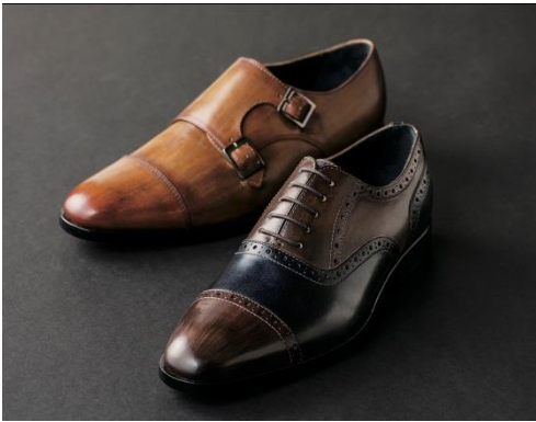
カスタムシューズ《パティーン仕上げ》 12色から選べるパターンオーダーシューズ 42,120円（税込）から