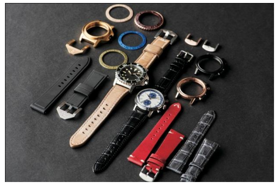
カスタムメイドの腕時計《UNDONE》 ケース・ダイヤル・針・ベルトなどが カスタムできる腕時計 35,640円（税込）から