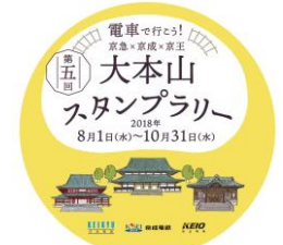
オリジナルヘッドマーク (イメージ)