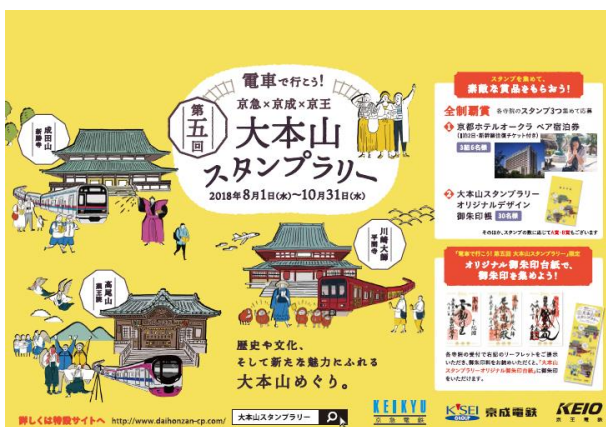
ポスター（イメージ）