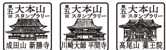
寺院スタンプ（イメージ）