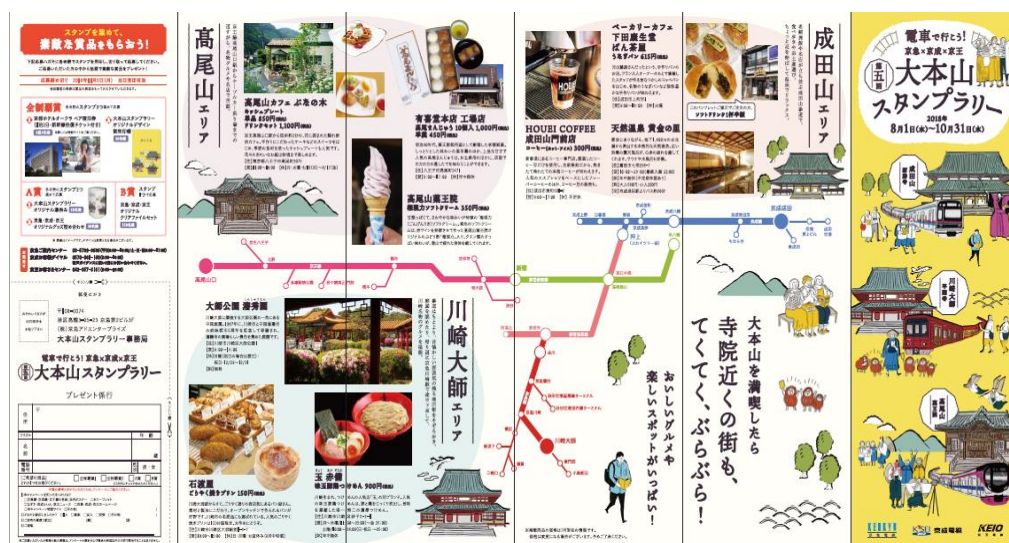
リーフレット (イメージ)