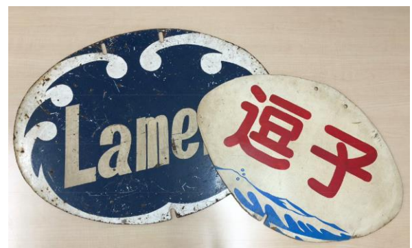
展示品の一例（イメージ）