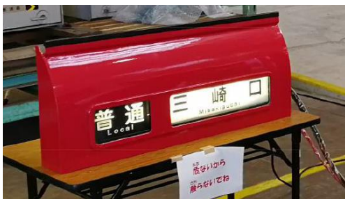
『触れるコーナー』で操作できる 行先表示器

スピードを調整する「マスコン」，行先を変える「行先表示器」，模擬車掌体験ができる「放送装置」，万が一の際に押す「踏切非常ボタン」等，京急電車の本物の部品を展示し，実際に触れて体験することができます。