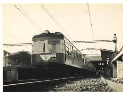
デハ 500 形