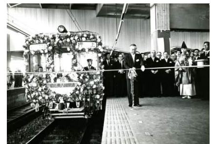
1968 年 相互直通開通式