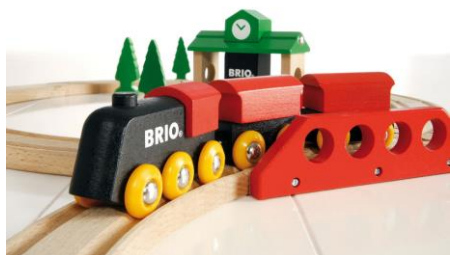
BRIOレールウェイ イメージ

「京急創立120周年×ブリオレールウェイ誕生60周年」を記念して特別体験ブースを設置いたします。