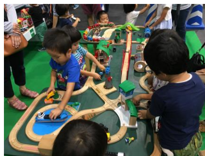
イベントイメージ