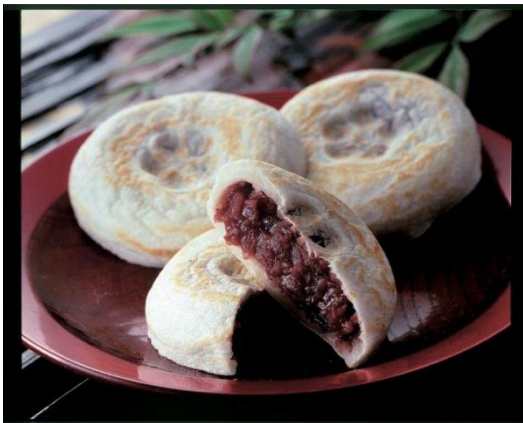
中はふんわりモチモチの食感が 楽しめる素朴な味わい 梅ヶ枝餅 (5コ入) 651円 (税込)