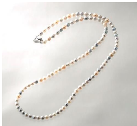
特別提供品【福岡市 KOSHO JEWELRY】 あこや真珠 マルチロングネックレス (約6～8mm珠, 全長約80cm) 《限定3点》 37,800円(税込)