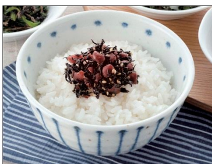
【太宰府市 太宰府えとや】 梅の実ひじき (150g) 702円 (税込)