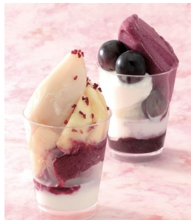
(左) 桃のパフェ (1コ) 864円 (税込) (右) ぶどうのパフェ (1コ) 864円 (税込)