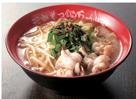
もつ鍋ちゃんぽん（醤油，味噌，塩） (1人前) 各918円（税込）