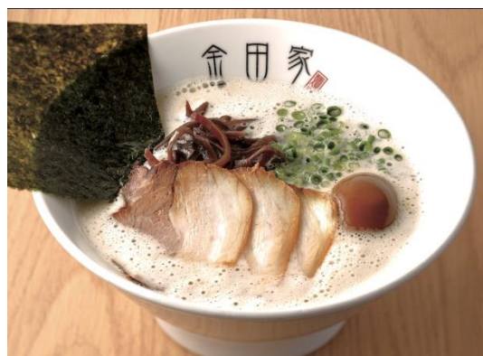
自慢の黒豚と泡系とんこつスープを堪能！ 黒豚らーめん煮玉子入り (1人前) 851円（税込）