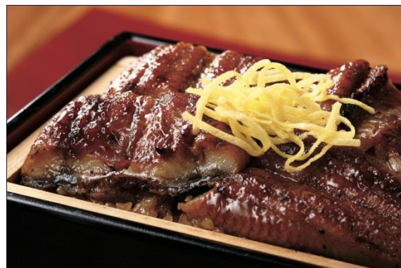
うなぎの旨味がご飯に染み込み うなぎはふっくらボリューム満点 うなぎせいろ蒸し (1折) 2,592円 (税込)