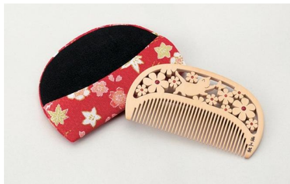
【福岡市 匠工芸】 透かし彫櫛『花と子猫』 (約10×5.5cm, 材質: つげ・珊瑚) 《限定3点》 32,400円(税込)