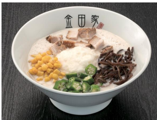
山芋とオクラで夏バテ解消！ 魚介風味 金田家 ベジタブルラーメン (1人前) 1,242円（税込）