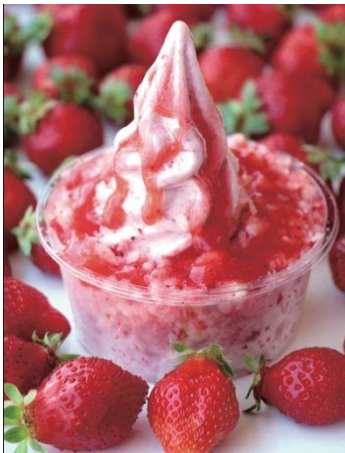
完熟あまおうの サクサクいちごパラダイス (1コ) 821円 (税込)