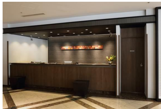
高輪ロビー・フロント (現況)