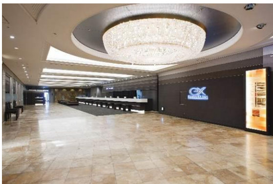
品川ロビー・フロント (現況)