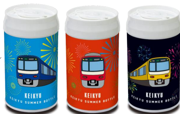
KEIKYU SUMMER BOTTLE

※ボトル本体および電車ピンズは購入自動販売機からランダムに出てくるため、購入時に選択はできません。