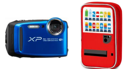
自販機型ケース付防水デジタルカメラ