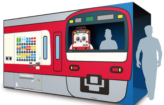
三浦海岸駅設置の 京急電車ラッピング自販機（顔出しパネル）