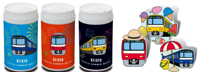
「KEIKYU SUMMER BOTTLE」と京急電車のピンズ