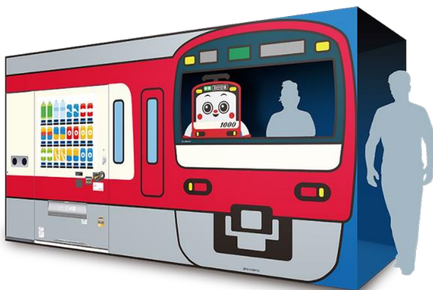
三浦海岸駅設置の京急ラッピング自販機 (顔出しパネル)