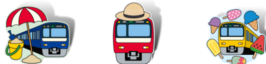
京急電車のピンズ