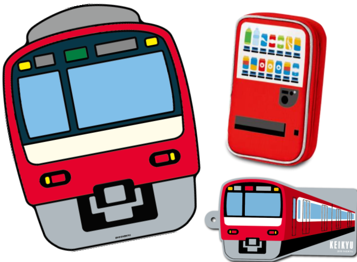
賞品「京急電車型ラウンドビーチタオル」