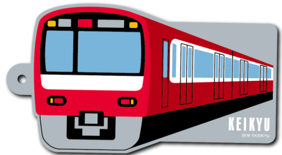
京急電車型パスケース