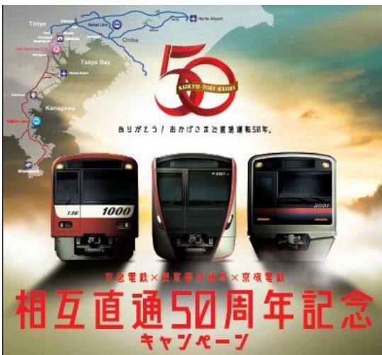
相互直通 50 周年記念ポスター