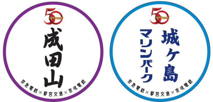
復刻運行用ヘッドマーク