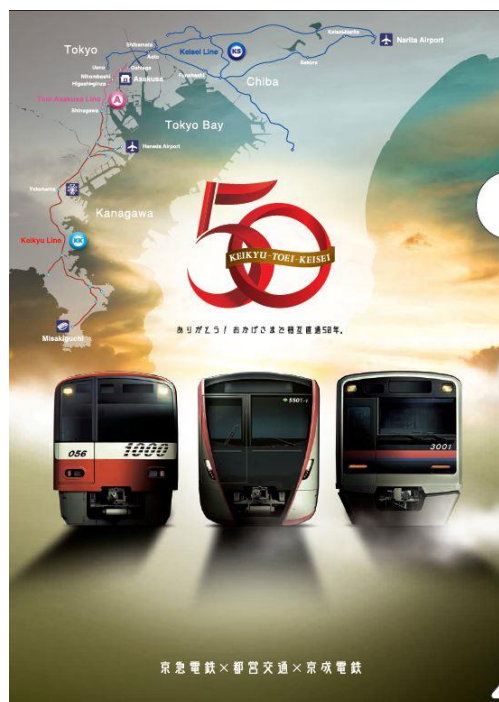
オリジナルクリアファイル