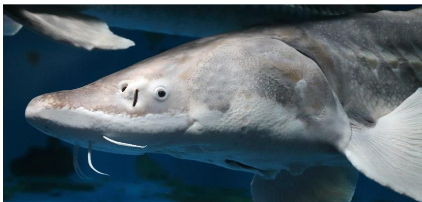
1972年に入館した【シロチョウザメ】46年経った現在も展示中のご長寿です

当館では、2017年5月27日の正面エントランス前に停留所新設をはじめ、開館50周年の記念企画としてさまざまな取り組みを展開してまいりましたが、今後も50周年を記念したさまざまな企画を実施する予定です。セレモニーの詳細は別紙のとおりです。