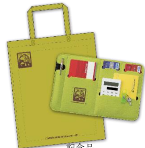
記念品 (イメージ) ※色は選べません