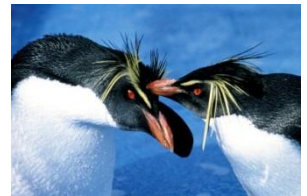
【キタイワトビペンギン】