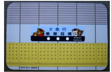
バスマット (乗車目標)