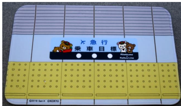
『バスマット（乗車目標）』