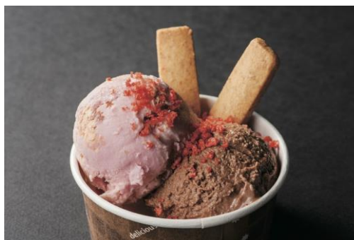
《クレームグラッセショコラ》