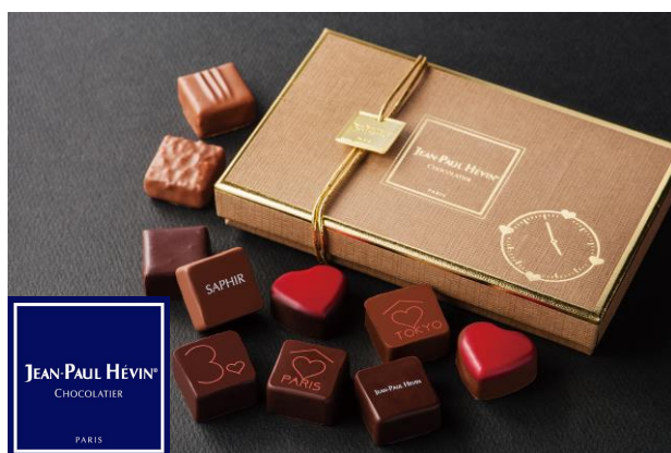
【ジャン＝ポール・エヴァン】