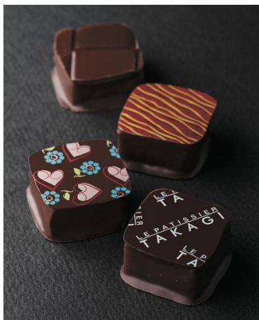
《ボンボンショコラ》