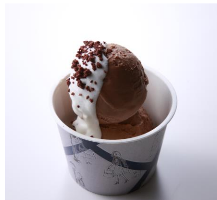
《ボワットウ ショコラ オルロージュ》