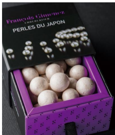
《パール デュ ジャポン》