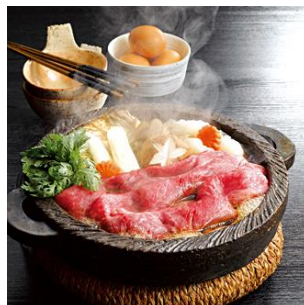
葉山牛賞品イメージ