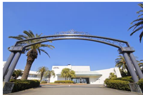
グループ施設イメージ