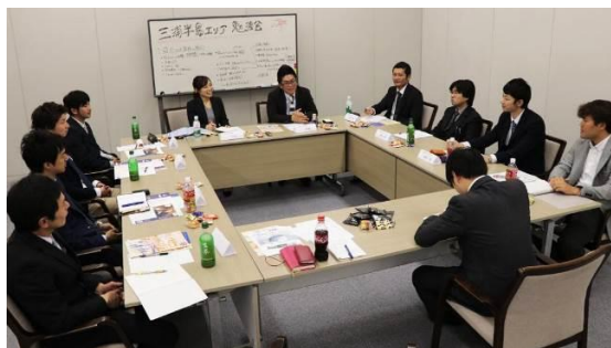
三浦半島エリア勉強会の様子

株式会社観音崎京急ホテル、株式会社京急油壺マリンパーク、三崎観光株式会社、株式会社葉山マリーナー、株式会社京急百貨店、株式会社京急ストア