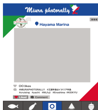
フォトパネルイメージ