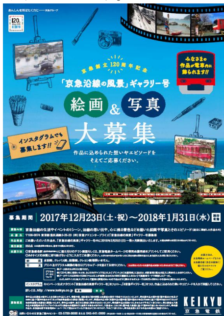
ポスターイメージ