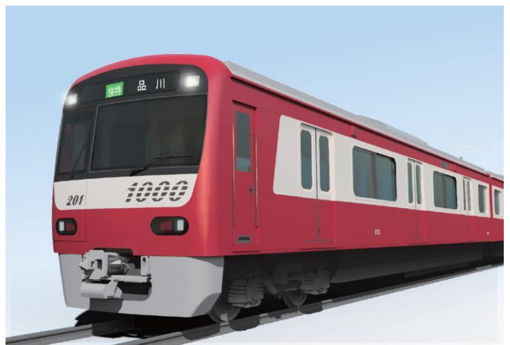
ギャラリー号に使用される予定の新1000形