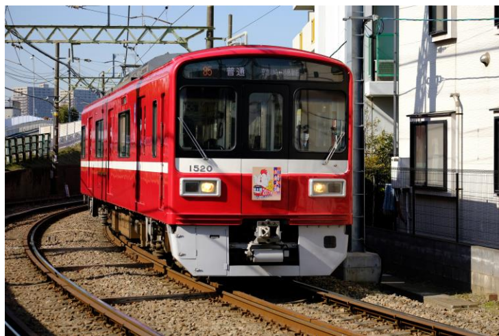
ヘッドマークを付けて運転した今年の京急大師線

京急電鉄，新年の恒例となった素晴らしいヘッドマークデザインのご応募をお待ちしております。詳細は別紙のとおりです。