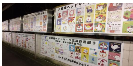
川崎大師駅構内に展示