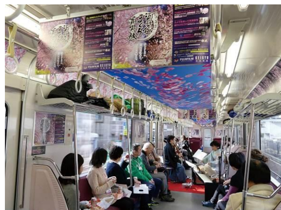
車内を自由にアレンジしてあらゆるイベントが可能