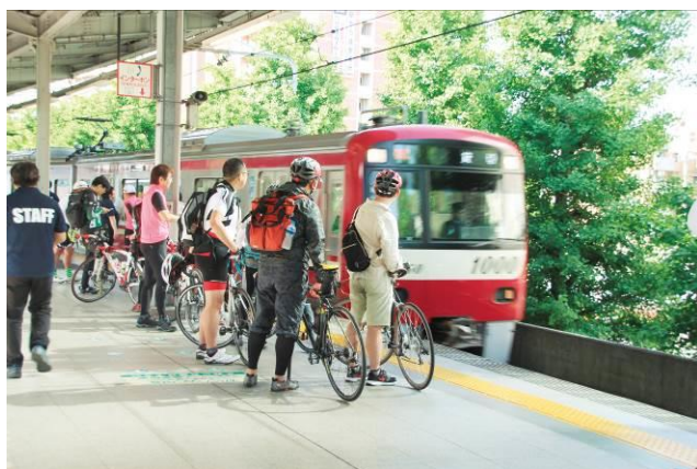
サイクルトレイン運行時の様子