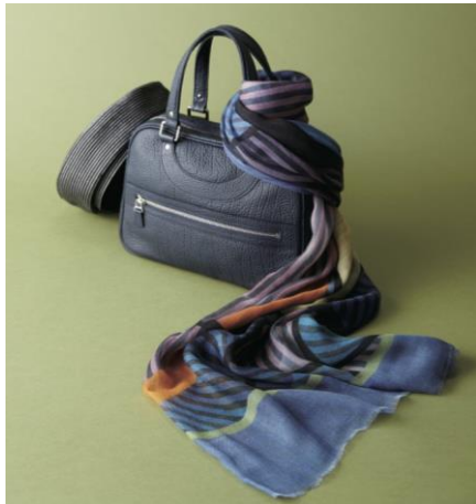
【ジャック・ル・コー】バッグ