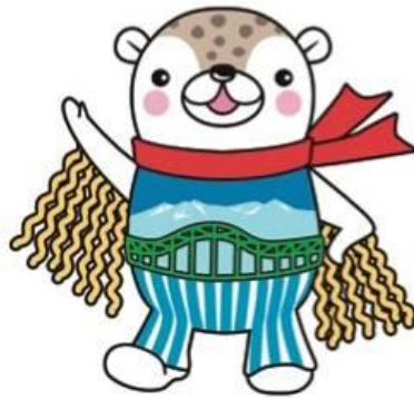
【旭川市PRキャラクター】