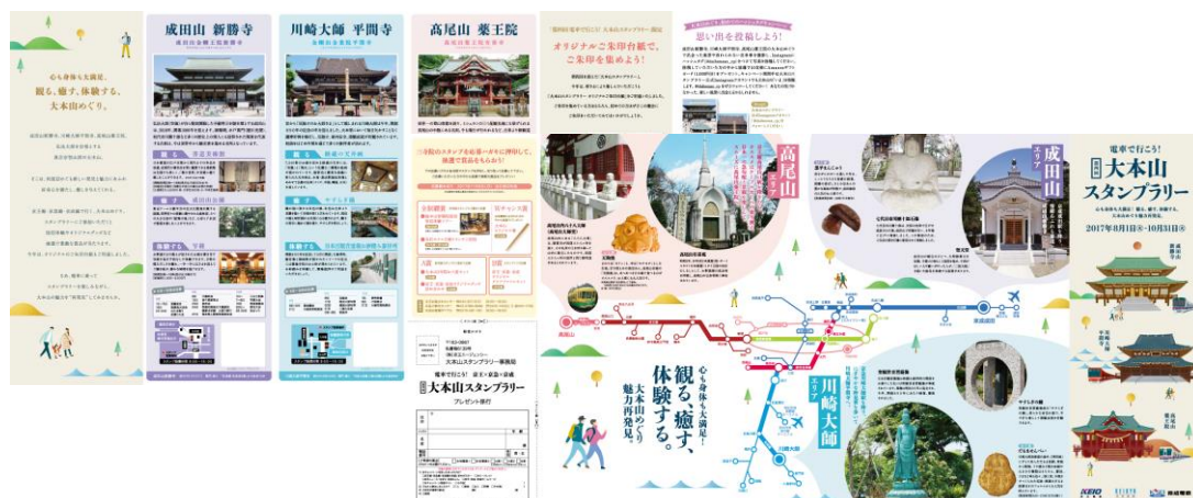
リーフレット (イメージ)