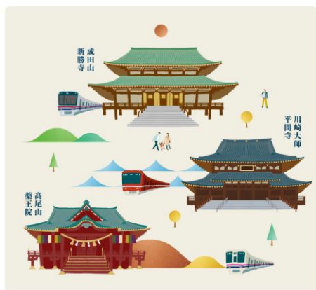
ポスター（イメージ）