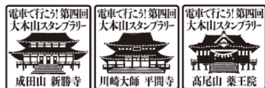
寺院スタンプ（イメージ）