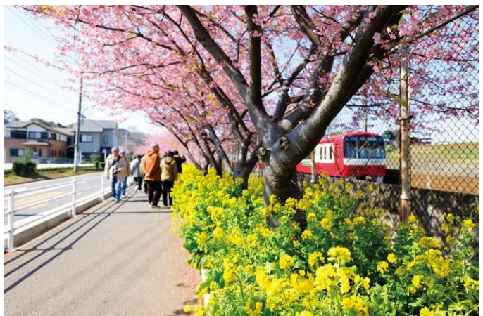
昨年の三浦の河津桜および菜の花の様子