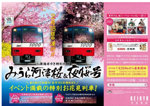
みうら河津桜号&夜桜号ポスター

京急電鉄では，三浦半島への観光誘客を通じて，交流人口の増加と地域活性化，豊かな沿線づくりを目指してまいります。詳細は別紙のとおりです。