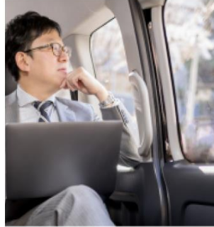
ホテルからお好きな場所まで快適に