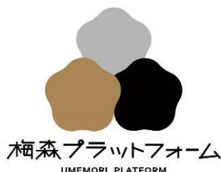
「梅森プラットフォーム」ロゴ