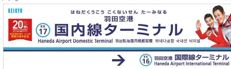
くりいむしちゅー直筆サイン入り「羽田空港国内線ターミナル駅」駅名看板