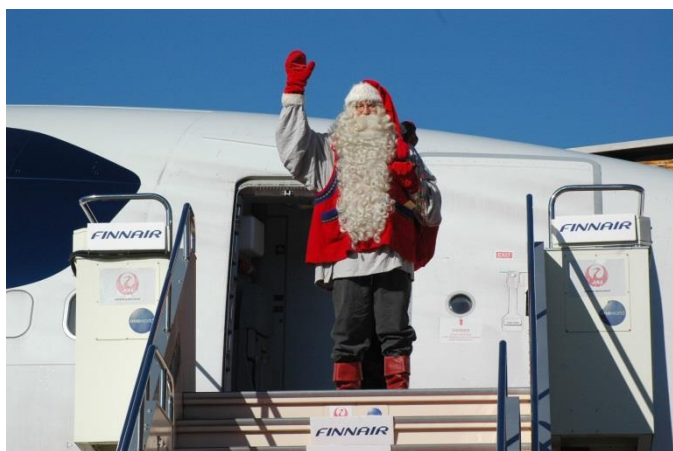
サンタクロース・ファウンデーション公認のサンタクロース