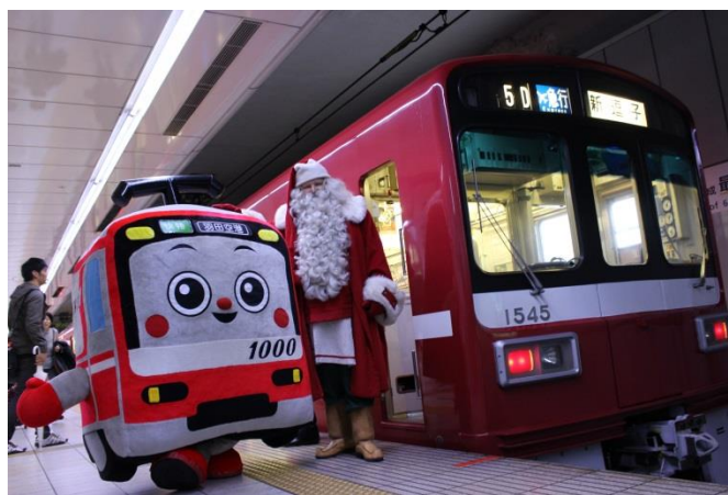
過去イベント時の様子