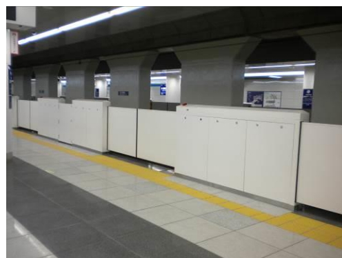
ホームドア（羽田空港国際線ターミナル駅）