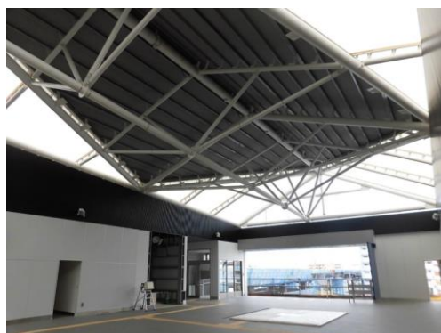
鉄道駅総合改善事業（金沢八景駅・新駅舎）