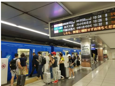
外国人旅行者で賑わう