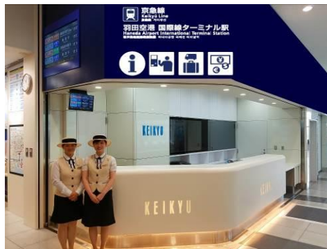
リニューアル後の京急T I C