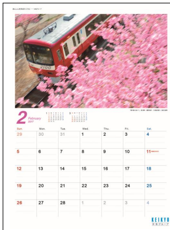
【壁掛けカレンダー】：B3縦型（H526mm×W365mm）