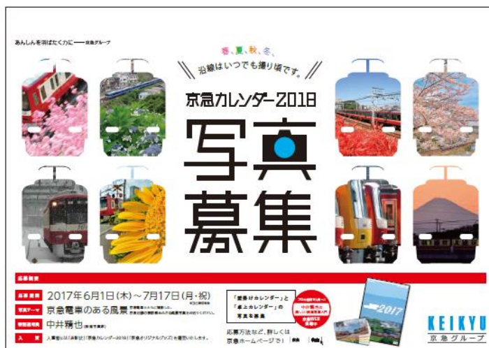
京急線内に掲出されるポスター