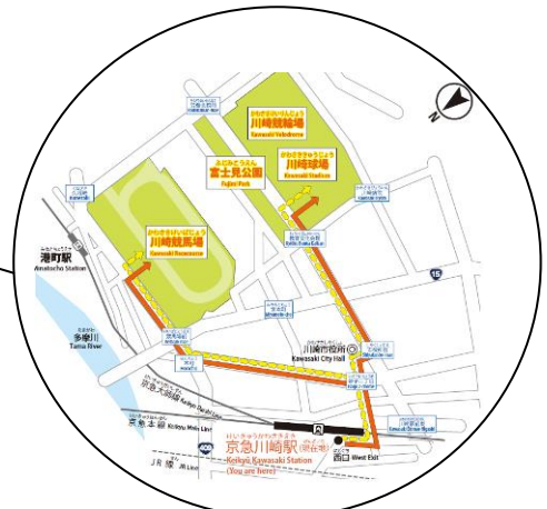
駅利用者目線に変更