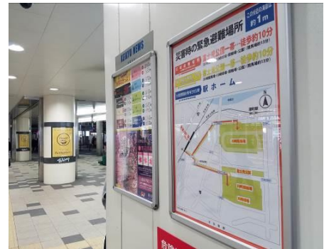
現在掲出されている案内図【京急川崎駅】

・図面上部を北方向に統一していた地図を掲示箇所に合わせ、わかりやすく図面の向きを変更