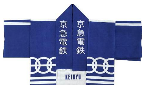
京急オリジナル 法被型手ぬぐい