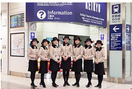
京急ツーリストインフォメーションセンター (京急TIC)