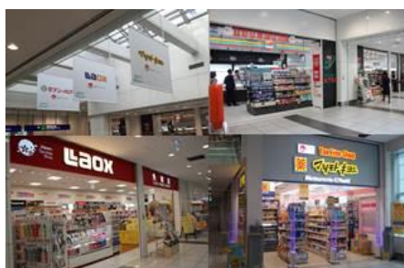
ウィングエアポート羽田