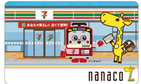
京急オリジナルデザイン nanaco カード

イ. 年賀ハガキを10枚まとめてご購入いただいたお客さまに応募ハガキを1枚進呈し、切手を貼って投函していただいた方の中から抽選で77名様に、京急オリジナルデザイン nanaco カードをプレゼント。