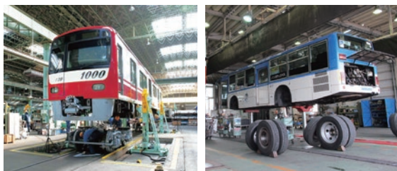
鉄道車両・大型自動車全般にわたる事業を幅広く展開

卓越した技術で信頼の品質を創造する輸送用機器修理業では、鉄道車両の更新、大型自動車の車検・整備や車両の改造・再生を柱とした事業を推進。また、駅構内や事務所の備品製造取付など、積極的に取り組んでいます。今後もお客さま第一主義を掲げ、様々な側面から地域社会に貢献していきます。