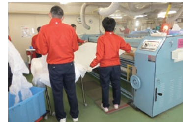
クリーニング工場での作業風景

2018年6月現在、障がい者の雇用の促進などに関する法律に基づいた京急グループの関係会社特例認定会社は、京急電鉄と京急ウイズを含め16社で、障がい者雇用率は2.44%となりました。