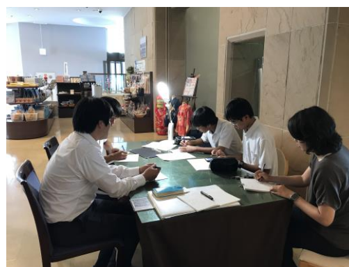
ポスターセッションの様子と駅・グループ施設でのフィールドワーク