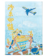
御朱印帳 (羽田神社の御朱印入り) 2,000円