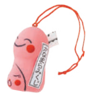
かなまらみくじ 500円

大師河原開拓時代に祀られた大師河原の総鎮守。御祭神は仁徳天皇です。「若宮」という名から、子ども、若者の守護神でもあります。境内社には奇祭「かなまら祭」で知られる「金山神社」も。