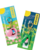
金山神社のお守り 各1,000円

お守りいろいろ 日本の伝統工芸、水引を使ったかわいらしいプレスレット型のお守りや、金山神社の子孫繁栄、安産祈願のお守りなども。