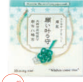
夏限定 願い叶う守 1,500円