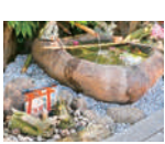
空港にあった甕を使った都内随一の大きさの水琴窟や鮮やかな朱色の千本鳥居。