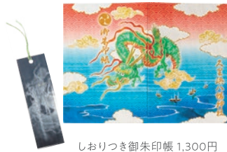
しおりつき御朱印帳 1,300円

養老4(720)年創建と伝わり、応神天皇を祀っています。社殿の天井に描かれている龍図は横須賀市の重要文化財に指定。明治時代、地元の名手で文人画家、長島雪操が墨一色で描いたものです。