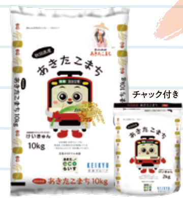
秋田県産あきたこまち 「あきたecoらいす」 2kg・5kg・10kg