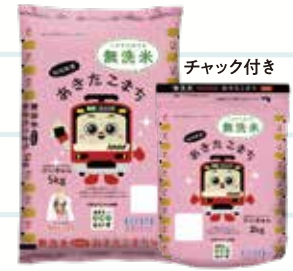
秋田県産あきたこまち 「あきたecoらいす」(無洗米) 2kg・5kg