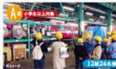
★京急車両工場見学【2020.1/18(土)9:00～12:00】