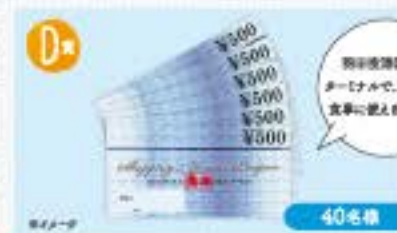
★ビッグバードショッピング&グルメターボン 3,000円分

※A～C賞については、小学生の応募は1名に限ります(応募は20歳以上)とご参加ください。