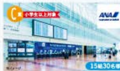
★ANA羽田空港ターミナル館見学【2020.3/27(金)】