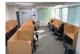
「多目的ラウンジ」室内(上大岡校)

Wi-Fiと電源コンセントも完備された「多目的ラウンジ」を新設 京急自動車学校上大岡校では2020年12月7日から、茅ヶ崎校では2021年3月18日から、当校の教習生が無料で利用できる「多目的ラウンジ」を新設しました。個別に仕切られているので、学科教習の自習やテスト勉強のスペースとしてご利用いただけます。また、各机にはWi-Fiと電源コンセントが完備されているため、新型コロナウイルス感染症拡大防止策として推進されているリモートワークや大学生のリモート授業にも対応しています。