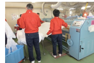
クリーニング工場での作業風景

地域社会の皆さまとのより良い関係を育んでいくために、障がいのある方や高齢の方が対応できる業務を集約し、より働きやすい環境を提供する一方で、雇用の一元管理などの業務の効率化を進めています。「あらゆる人がともに住み、ともに生活できるような社会を築く」というノーマライゼーションの理念を掲げ、「生産性を発揮できる仕組みづくり」「職域拡大の推進と個人の能力向上」「人材育成とサポート体制の強化・促進」を運営方針とし、駅清掃業務、クリーニング業務や京急グループ本社ビル内で宅配受付・立会業務などの事業を行っています。京急グループ一丸となって職域の拡大を目指し、「障がい者雇用の促進」と「ノーマライゼーション意識の徹底」に努めています。2021年6月現在、障がい者の雇用の促進などに関する法律に基づいた京急グループの関係会社特例認定会社は、京急電鉄と京急ウィズを含め14社で、障がい者雇用率は2.87%となりました。