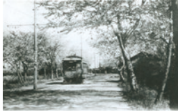
六郷橋～大師間 を行く電車