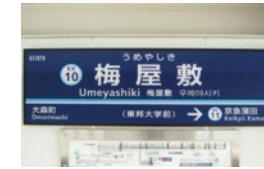
副駅名称の入った駅看板