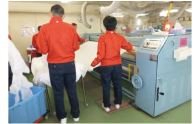
クリーニング工場での作業風景

地域社会の皆さまとのより良い関係を育んでいくために、障がいのある方や高齢の方が対応できる業務を集約し、より働きやすい環境を提供する一方で、雇用の一元管理などの業務の効率化を進めています。「あらゆる人がともに住み、ともに生活できるような社会を築く」というノーマライゼーションの理念を掲げ、「生産性を発揮できる仕組みづくり」「職域拡大の推進と個人の能力向上」「人材育成とサポート体制の強化・促進」を運営方針とし、駅清掃業務、クリーニング業務や京急グループ本社ビル内で宅配受付・立会業務などの事業を行っています。京急グループ一丸となって職域の拡大に努め、「障がい者雇用の促進」と「ノーマライゼーション意識の徹底」に努めています。2020年6月現在、障がい者の雇用の促進などに関する法律に基づいた京急グループの関係会社特例認定会社は、京急電鉄と京急ウイズを含め14社で、障がい者雇用率は2.85%となりました。