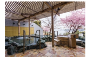
化石海水を源泉とした油壺温泉

三浦半島油壺にある、小網代湾一望の温泉露天風呂が人気の和風ホテル。宿泊のほか日帰り入浴でも温泉を楽しめます。個室露天風呂付客室では源泉掛け流しにて油壺温泉を満喫でき、館内の「活魚レストラン潮彩」では、小網代湾の雄大な眺めとともに三崎まぐろや地元の海の幸をふんだんに使った料理が味わえます。全ての宿泊プランに、隣接する「京急油壺マリンパーク」の入園券がセットになっているのでお得です。