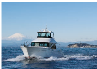
江ノ島・裕次郎灯台周遊クルージング

日本におけるヨット発祥の地である葉山に立つ、歴史と伝統を誇るマリーナ。ヨットやモーターボートの艇置のほか、ビジターでショートクルージングやレンタルボートの体験もできます。さらに、複数のレストラン、マリウエアブランドを取り揃えたブティックや宴会場を併設した複合商業施設として、地元をはじめ遠方からも多くの方に利用いただいています。海の向こうに江ノ島や富士山を望むことができる絶好のロケーションから、夕日を見るスポットとしても人気です。