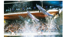
イルカのジャンプ

三浦半島の西南端にある海のレジャーランド。相模湾に生息する魚や大型のサメを常設する水族館「魚の国」、三浦半島の自然が詰まった「みうら自然館」、人気者のコツメカワウソをはじめ、希少な生き物たちが暮らす水辺や洞窟を再現した「かわうその森」など、エリアごとにさまざまな生き物や珍しい展示を見ることができます。屋内大海洋劇場「ファンタジウム」では、音響設備や照明を駆使したミュージカル仕立てのいるか・あしかパフォーマンスを毎日公演。水辺の生き物とのふれあいなどが体験できる「すいぞくかん学園」も人気で（有料・予約制）、ペットも入園できる水族館です（要手続）。また、2019年11月1日にオープンしたドッグランには愛犬と一緒に楽しめる遊具のほか、相模湾を望む丘などを配置して、公園としても楽しむことができます（ペット有料・要手続）。