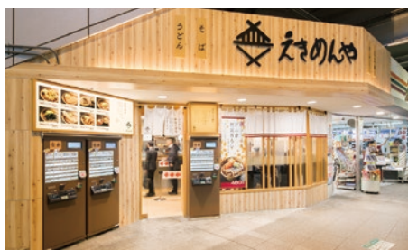
えきめんや品川店

沿線を中心に、東京・神奈川で「そば処 えきめんや」「焼肉BUSAN」「紅龍小吃 ホンロンジャオチー 」「紅龍酒家」などの直営店舗や、「タリーズコーヒー」「ケンタッキーフライドチキン」「ヴィ・ド・フランス」などのフランチャイズ店舗など、さまざまな外食サービスを展開しています。安全で安心な「食・サービス」と、笑顔あふれる「空間」の提供により、皆さまが快適で暮らしやすいまちづくりに貢献します。