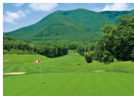
長野京急カントリークラブ

爽やかな高原気候で年間を通じてコースコンディションの良い「長野京急カントリークラブ」と、南房総の温暖な気候で地形を生かしたアップダウンの少ないコースの「市原京急カントリークラブ」、2つのゴルフ場を運営しています。