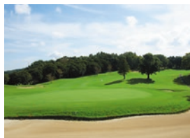
市原京急カントリークラブ